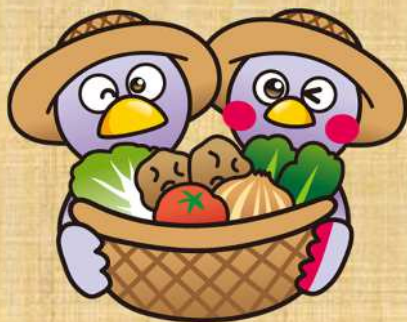
埼玉県マスコット「コバトン」、「さいたまっち」