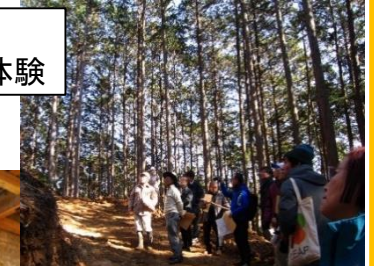
イメージ 石蔵から町の 地域資源を発信