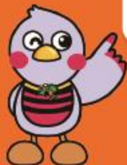
埼玉県マスコット 「さいたまもっち」