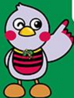
埼玉県マスコット 「さいたまもっち」