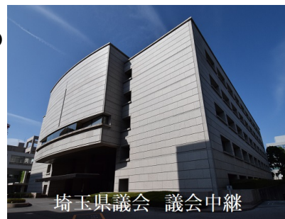
埼玉県議会 議会中継