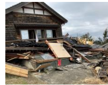
地震による被害を最小限に抑えるため耐震改修の補助や出前講座等の啓発事業を行っています。

また、大規模な地震の発生が予測される中で、災害に備えた耐震化の促進にも力を入れています。