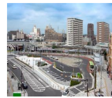
人口減少、超少子高齢社会において、誰もが安心して暮らせるまちづくりの実現に向け、時代に合わせた都市計画の見直しをしています。

また、市街地再開発事業や街並み景観に関する仕事など、魅力的なまちづくりに取り組んでいます。