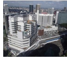
大規模施設の新築工事も行っています。写真は埼玉県立小児医療センターです。

県有施設(県営住宅含む)の新築・改修工事について設計及び施工監理を行います。近年では、新しい施設の整備から既存施設の利用形態を見直し、機能向上のための増改築・改修、耐震補強など施設の有効活用や経年劣化に対応した改修を行っています。