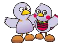
埼玉県マスコット 「コバトン」 & 「さいたまっち」