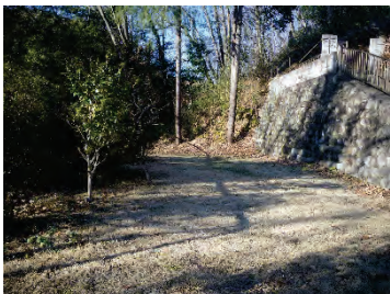
【階段先の芝生広場】