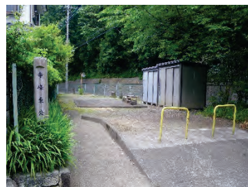
【公園入口（平行棒撤去）】