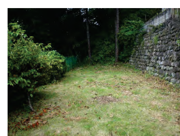
【階段先の芝生広場】