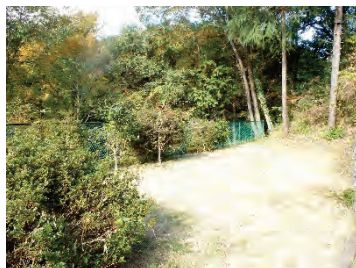
【階段先の芝生広場】