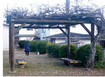
【利用者状況；犬の散歩】