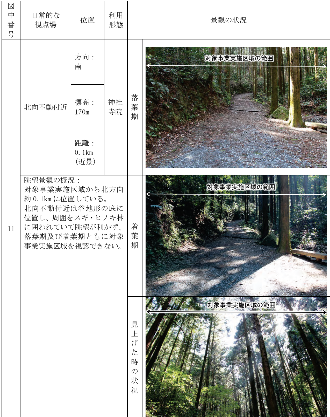
表 8-1-7-6(10) 主要な眺望景観の概況