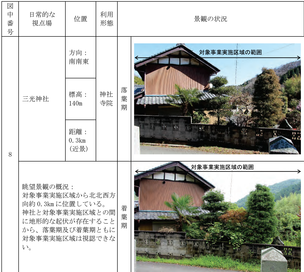
表 8-1-7-6(7) 主要な眺望景観の概況