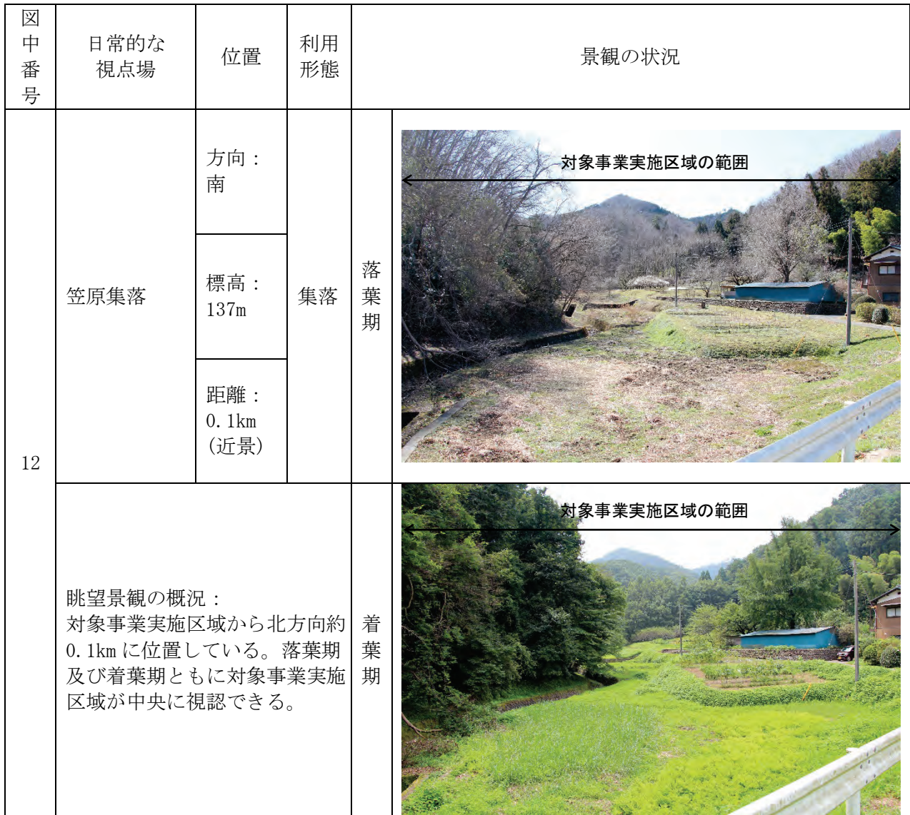
表 8-1-7-6(11) 主要な眺望景観の概況