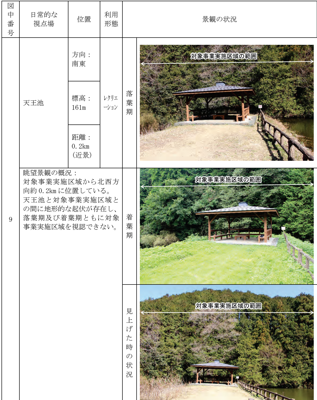
表 8-1-7-6(8) 主要な眺望景観の概況