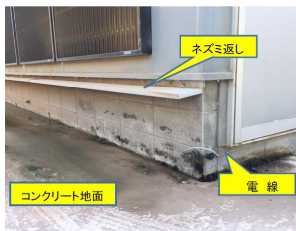
ねずみ及び害虫の駆除