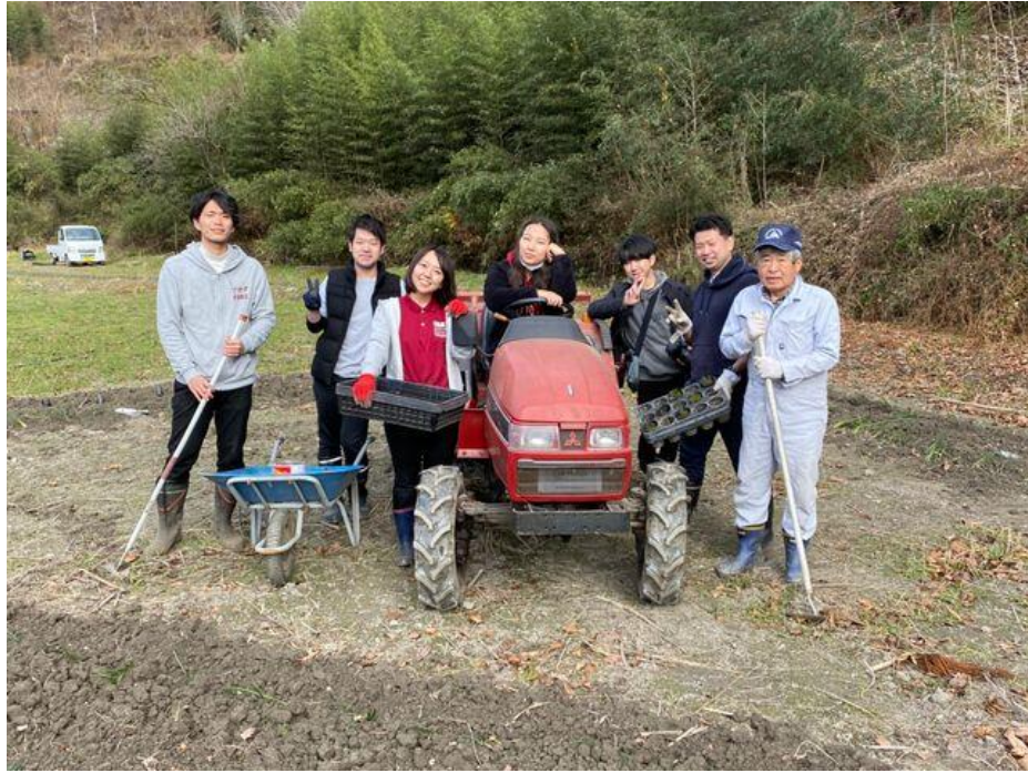
図3 休耕地を活用した植樹活動