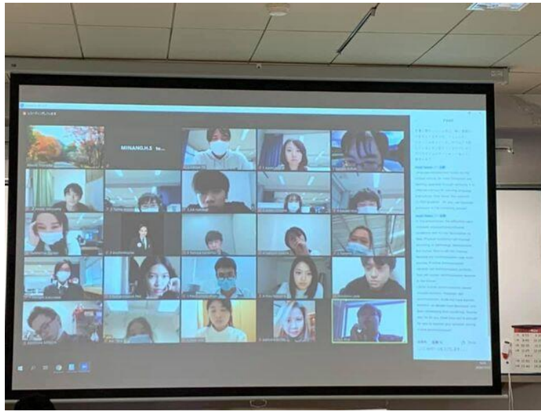
図 1 皆野中学校，皆野高校，早稲田大学，タイパンヤピワット経営大学との交流の様子