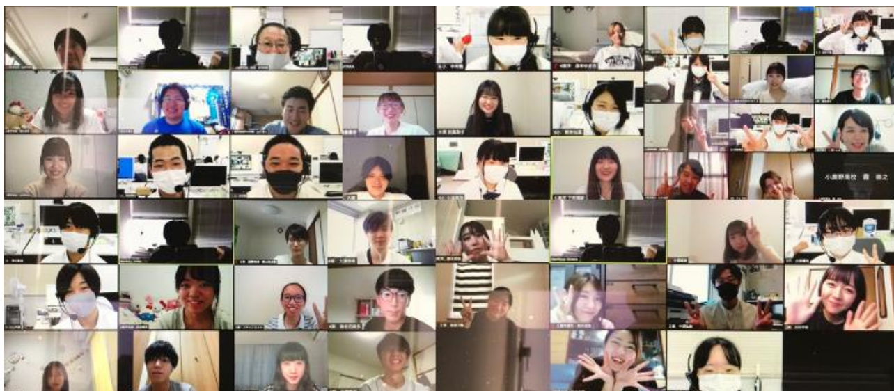
写真1 オンラインワークショップの様子

この他にも、東洋大学国際地域学科「PS（プロジェクトスタディーズ）ワークショップ」（2020年10月21日～31日、於：オンライン）等の機会にて本活動を報じ、随時、活動内容の具体化や見直しに努めた。さらに、本年度は、小鹿野町における潜在的な地域資源として「看板建築」に着目して卒業論文を執筆した学生が現れたことも特筆しておきたい。