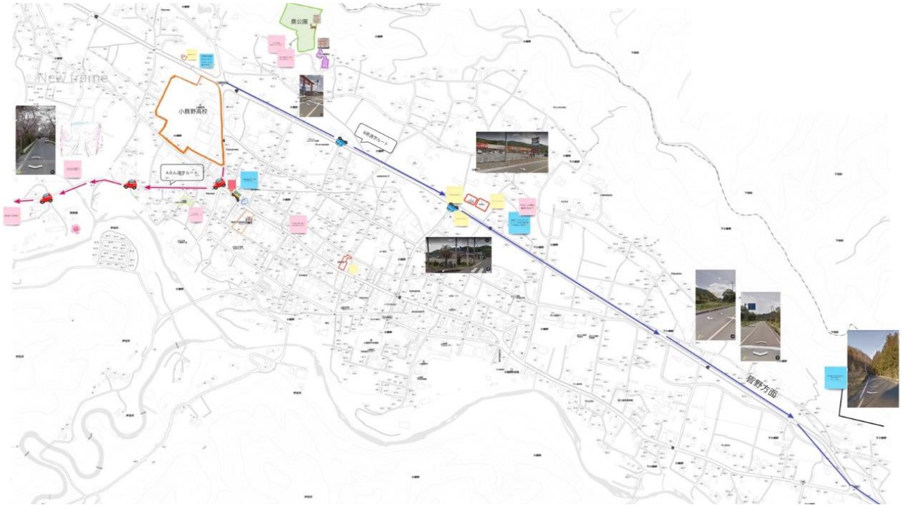
図2 みちくさまっぷの総括例

また、参加した小鹿野高校生・東洋大学生は皆、ワークショップを経てその経験を蓄積したという点も本年度の成果として加えておきたい。