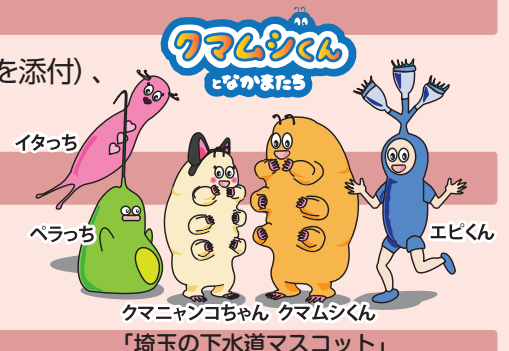
クマニャンコちゃん クマムシくん 「埼玉の下水道マスコット」

公益財団法人埼玉県下水道公社 埼玉 150 周年記念マンホールデザインコンテスト担当