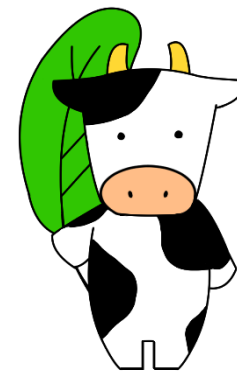
募金グッズ (干支のバッジ)