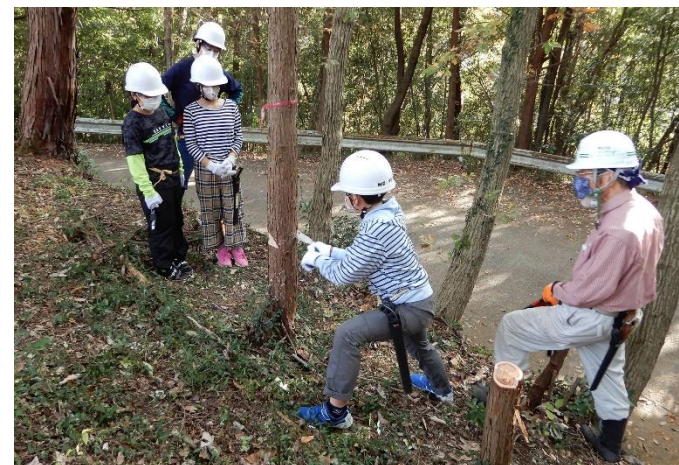
緑の少年団 活動の様子