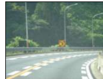
車道の幅員、曲線部の線形

イ 基準は安全で円滑な交通を確保することが目的であり、道路構造に関する基本的事項は変わらないため、原則として政省令どおりに規定