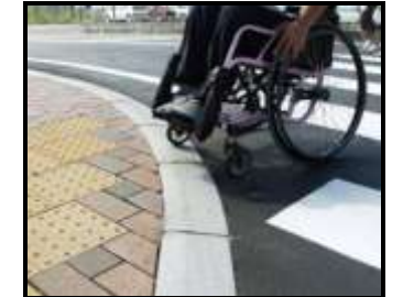
歩道の縁端、誘導用ブロック