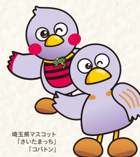
埼玉県マスコット 「さいたまっち」 「コバトン」