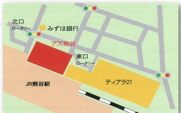
JR熊谷駅ビル・アズ熊谷本館6階