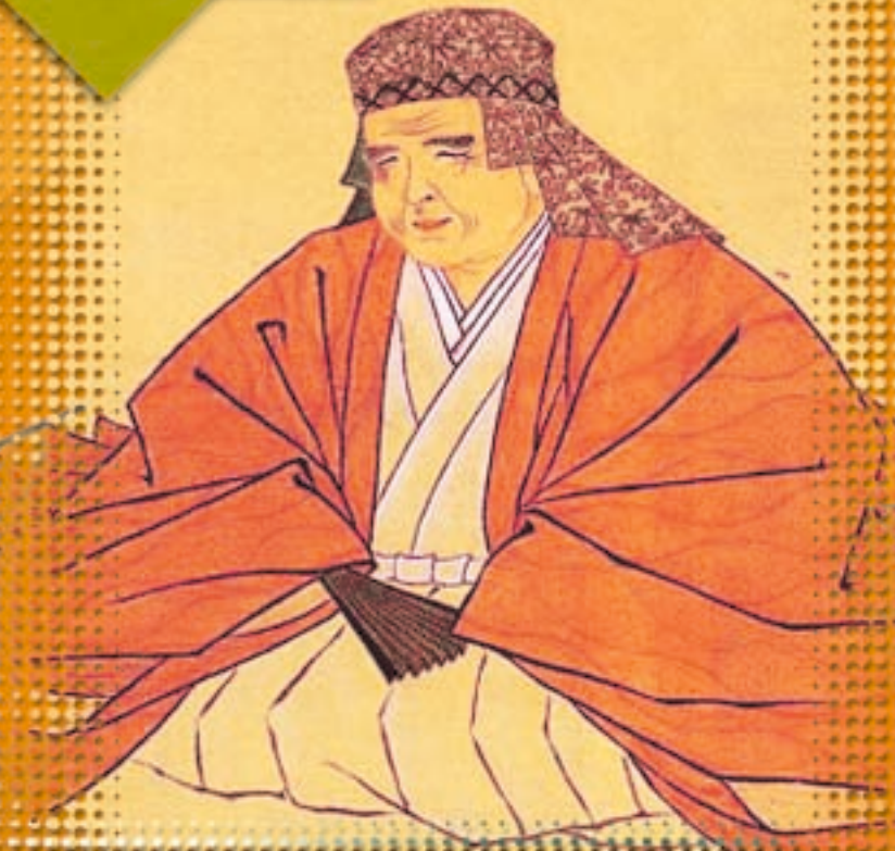
塙保己一 (本庄市) 国学者・『群書類従』の刊行

なかでも、自らの障害を乗り越えて『群書類従』の編纂など数多くの偉業を成し遂げた 塙保己一 、様々な企業の設立や育成に携わる一方で多くの社会事業にも尽力し、近代日本経済の礎を築いた 渋沢栄一 、新たな分野に果敢に挑戦し、日本の公認女医第1号となった 荻野吟子 の3人の生き方は、現代に生きる私たちの進むべき道を指し示してくれているのではないのでしょうか。