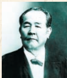
しぶ さわ えい いち 渋沢栄一 (1840~1931)

ヘレン・ケラーが来日して講演した際、塙保己一を「私の人生の目標とした人であり、心の支えです」と語っています。