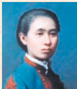
おぎ の ぎん こ 荻野吟子 (1851~1913)

常に「論語」を処世の基本理念とし、道徳経済合一説を唱え、第一国立銀行をはじめ、鉄道・製紙・造船など500社にもものぼる企業の設立・育成に関わりました。また、福祉や教育などの社会事業にも熱心に取り組み、600余りの社会事業に力を注ぎました。