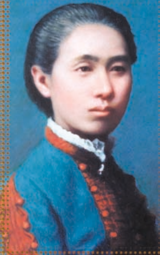
荻野吟子 (熊谷市) 日本の公認女医第1号