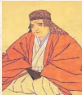
はなわ ほ き いち 塙保己一 (1746~1821)