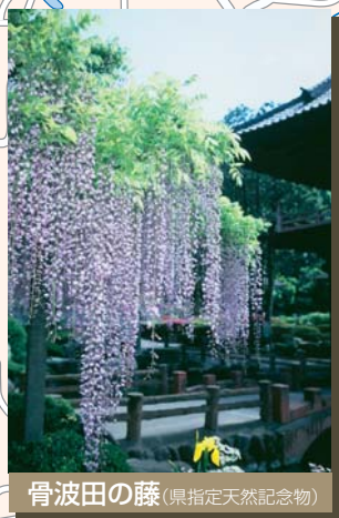
骨波田の藤 (県指定天然記念物)