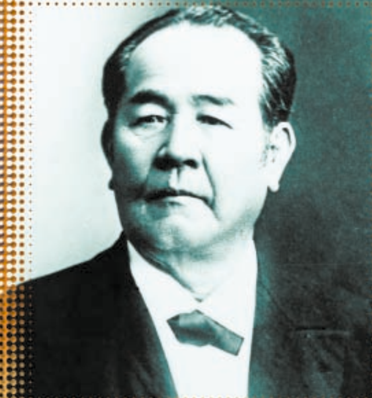
渋沢栄一 (深谷市) 日本近代経済社会の父