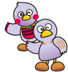
埼玉県マスコット さいたまっちょ&コバトン

※ 保育サービスは、6か月以上の未就学のお子さまに限ります。 無料、定員10名（申込順）