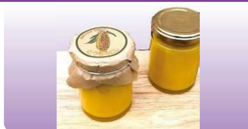
とうもろこしジャム 125g ¥540