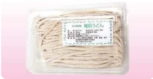
地粉うどん 350g ¥380