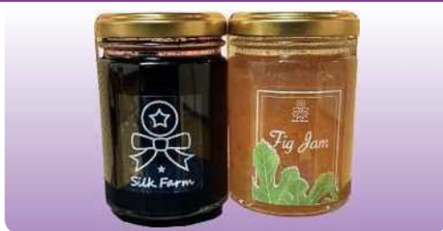
ブルーベリージャム 150g ¥600 250g ¥1,000 いちじくジャム 150g ¥510