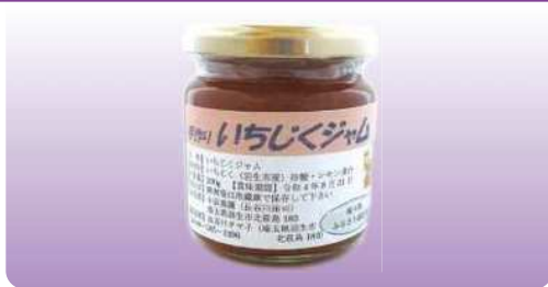
手作りいちじくジャム 200g ¥450