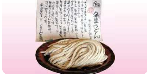
条里うどん 500g ¥500