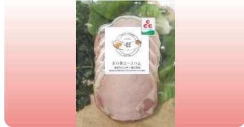
彩の国ローズハム 80g ¥390