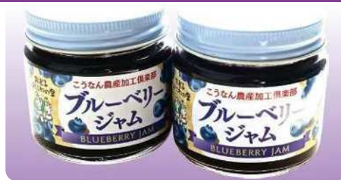
ブルーベリージャム 135g ¥570