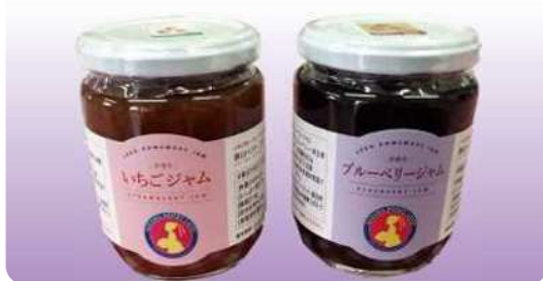
●ブルーベリージャム(プレザーブスタイル) 260g ¥1,200 いちごジャム 260g ¥1,200