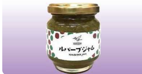
ルバーブジャム 90g ¥350