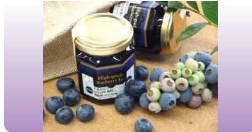
ブルーベリージャム 125g ¥700