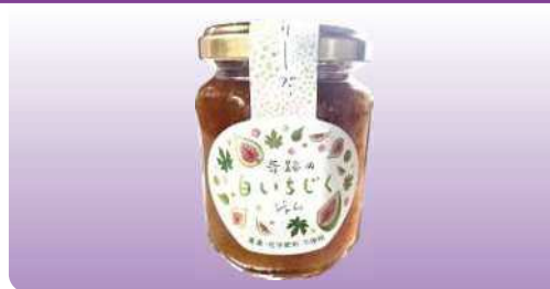
白いちじくジャム 140g ¥702