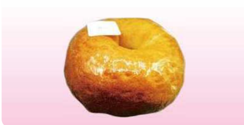
プレーンベーグル 90g ¥200