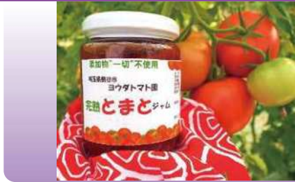
とまとジャム 280g ¥950