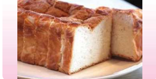
麴パン 1個 ¥1,080