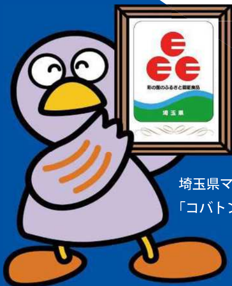
埼玉県マスコット 「コバトン」