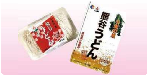
熊谷うどん(半生) 160g×2袋 ¥750 熊谷うどん(生) 500g ¥550