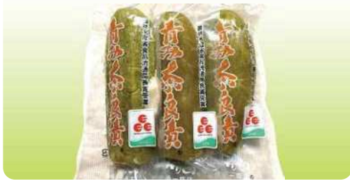
青み奈良漬 1枚入 ¥410