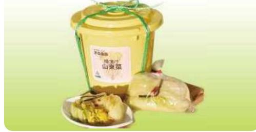
渋谷農園の山東菜漬 3kg樽 ¥3,350 5kg樽 ¥5,450 量売り(1kgあたり) ¥950~