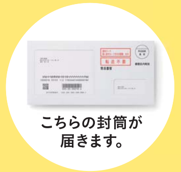
こちらの封筒が 届きます。

※10月5日時点の住民票に記載されている住所(居所を登録された方は当該居所)に届きます。