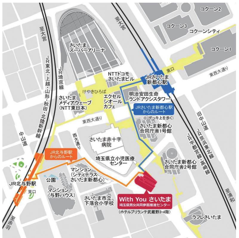
埼玉県立小児医療センター