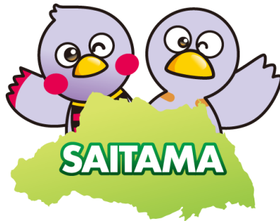
埼玉県マスコット コバトン&さいたまっち