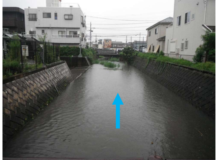
b. 【出口側（41条橋観測局）】