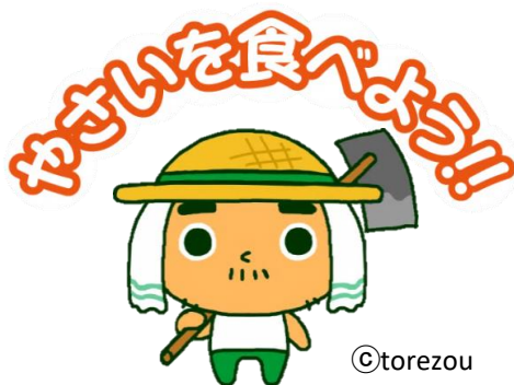
JAいるま野 農産物オリジナルキャラクター「とれ蔵」