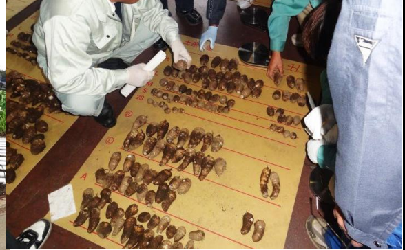
さいとも共進会審査 生産者の選荷選別作業の再確認と情報交換の場にもなっております