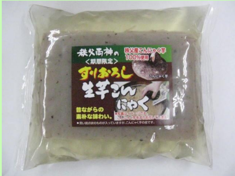
(現物の写真) (写真に貼付)