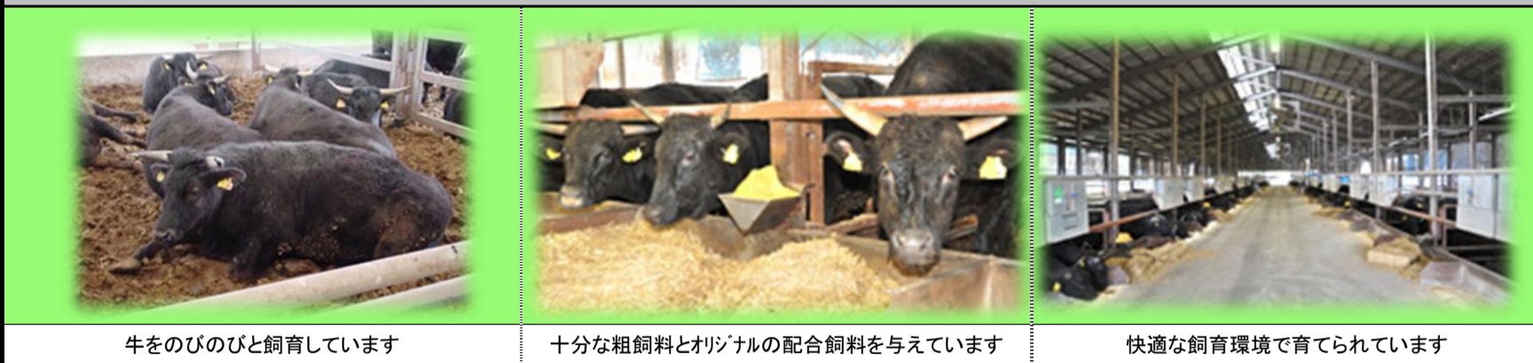
牛をのびのびと飼育しています