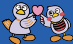
埼玉県マスコット「コバトン&さいたまっち」