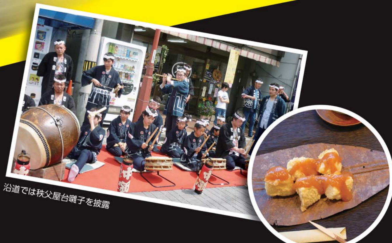
沿道では秩父屋台囃子を披露