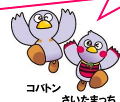
コバトン さいたまっち