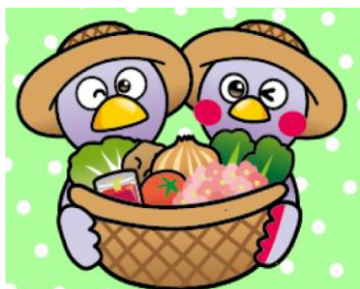
お取り寄せ 埼玉県産農産物応援サイト

埼玉県産の花や狭山茶、畜産物をご自宅から電話やWEBで注文できる農家などをまとめたページを開設。 県ホームページのトップ画面からアクセスできます。