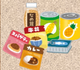
レトルト食品 調味料、缶・瓶詰