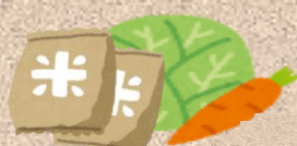
野菜・果物・米など （日持ちするものに限る）