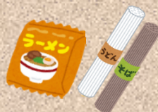
インスタント麺・乾麺 乾物（ふりかけ・海苔など）