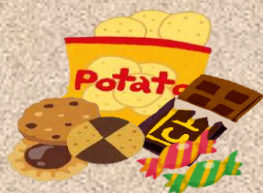
お菓子・スナック類 ジュース・コーヒーなど