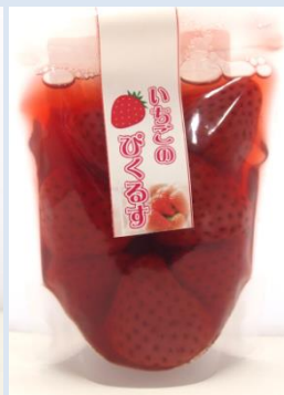
いちごのぴくるす