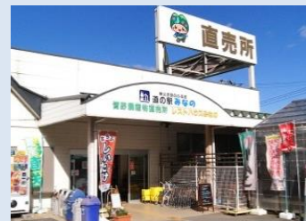
道の駅 農産物直売所