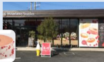
農業者直営のスイーツ専門店