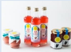
プリン、サイダー、ジャム