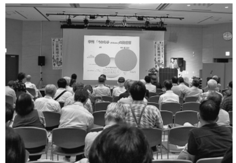
農と里山シンポジウム

また、三富伝統農法促進事業として、三富地域で農業の持続的発展のために地域の農業者が実施する3件のPR活動等に対して支援を行いました。