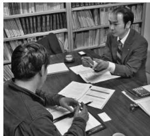
社労士による雇用相談

②平成30年度に設立された埼玉県農業経営相談所と連携し、専門家を活用した経営改善への伴走型支援（写真）