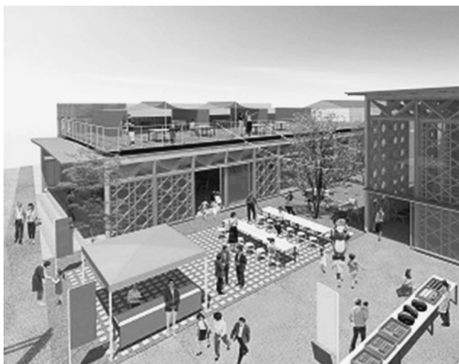
完成時のイメージパース

完成した基本設計によると大通りに面した建物は、2つの棟が中庭を挟んで東西に並ぶように配置し、南面には大きなガラスが採用され、開放性や採光性を高めています。