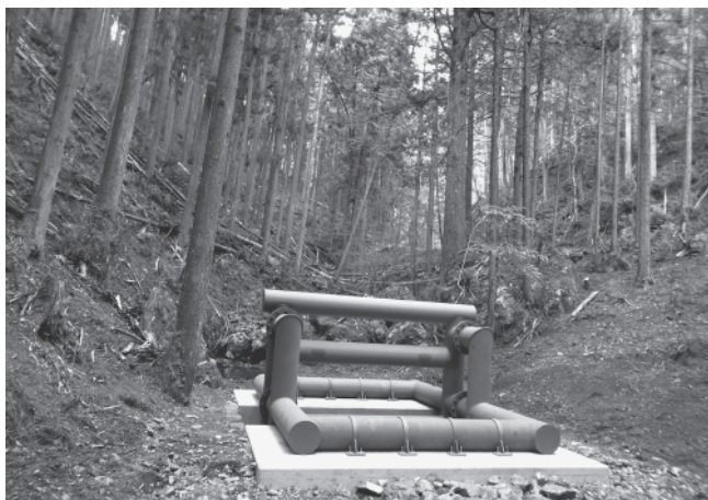
流木を捕捉する鋼製の構造物

九州北部豪雨による流木災害の発生を受けて、川越農林振興センター林業部では、2018年度に流木災害対策工事を2箇所で行いました。