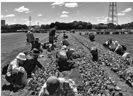
野菜収穫体験ツアー

アー（5月11日）、農と里山シンポジウム（9月）、さんとめの木をいかす展（11月）、千人くず掃き（1月）を開催しました。協議会の主催事業以外にも三富地域の市町等で開催された農業祭・産業祭等に参加し、三富地域のPRを行っています。