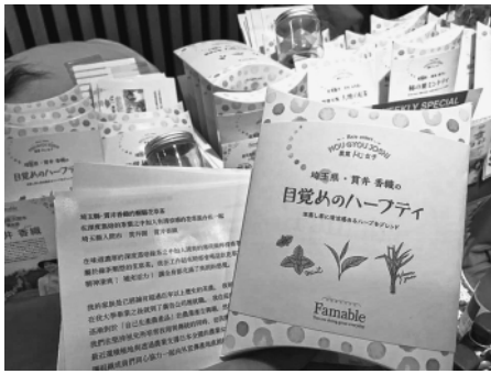
貫井園の「目覚めのハーブティ」