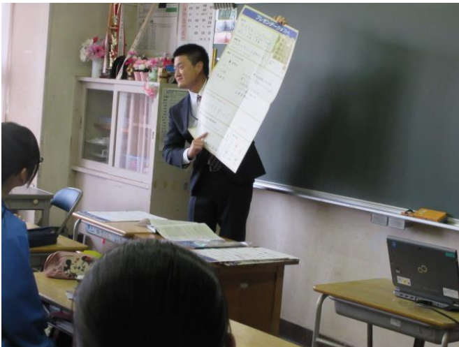
既習事項の想起 学習の見直しをもたせる