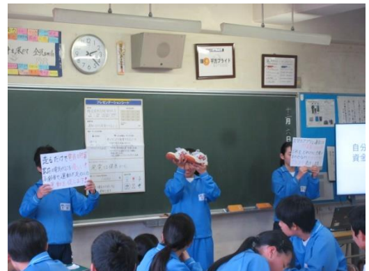
会社のPR～企業が社会に対して負う 責任とは何だろうか～