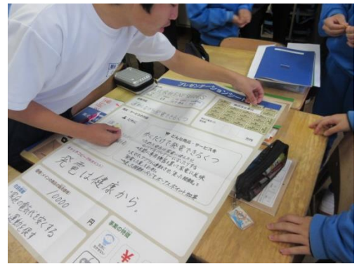
投資についての疑似体験