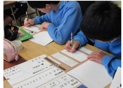
本時のふりかえり