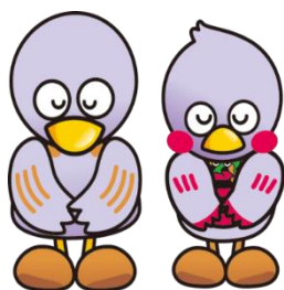
埼玉県マスコット コバトン&さいたまっち