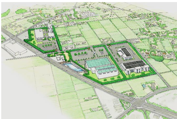
羽生上岩瀬地区完成予想図