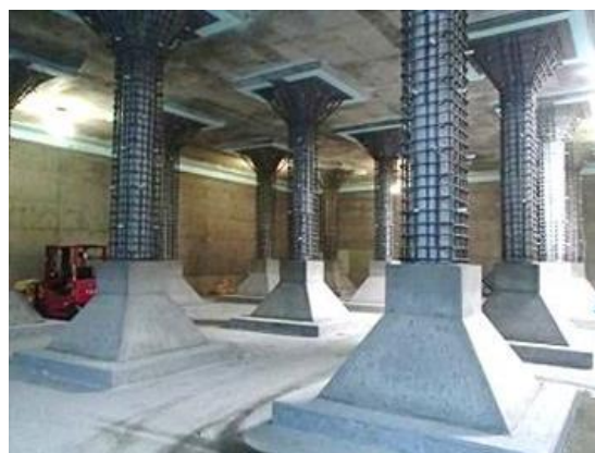
浄水池耐震補強工事事例【部材厚増】