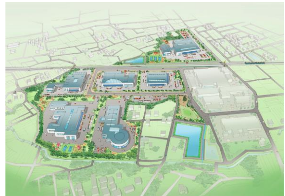
寄居桜沢地区完成予想図