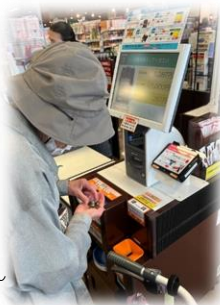
訪問型サービスC事業

要介護になる前段階（事業対象者・要支援者）から、自立した生活を続けられるよう、通所や訪問での支援を行い、運動・栄養・口腔機能の向上プログラムを提供します。ふつうの暮らしの中で自立し、したい事の実現にむけ応援します。