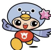
鳩山町マスコット キャラクターはーとん

通いの場を休止している方やフレイルリスク該当者など、閉じこもり傾向がある方に、再び目標を持って行動変容に繋がるよう、運動や栄養等の向上プログラムの提供や、したい事の実現に向けた教室を行いました。