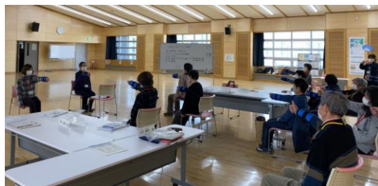
はあとふるパワーアップ教室

通いの場を休止している方やフレイルリスク該当者など、閉じこもり傾向がある方に、再び目標を持って行動変容に繋がるよう、運動や栄養等の向上プログラムの提供や、したい事の実現に向けた教室を行いました。