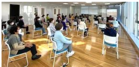
ときも健幸スタジオ@すくすく川越

自治会単位などで行ってきた、住民主体の通いの場。コロナ禍で変わった環境に合わせ、あらためて取組みの良さ、元気を共有するいもっこ体操をもっと多くの人に知ってもらう・体験してもらうための場を、市民が行きやすい場所で開催しはじめました。