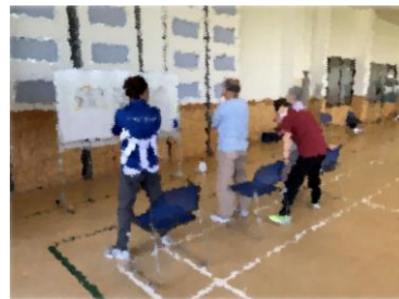
通所型サービスC事業

要介護になる前段階（事業対象者・要支援者）から、自立した生活を続けられるよう、通所や訪問での支援を行い、運動・栄養・口腔機能の向上プログラムを提供します。ふつうの暮らしの中で自立し、したい事の実現にむけ応援します。