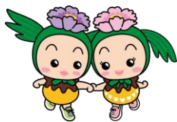
東松山市マスコットキャラクター まっくん・あゆみん

特定の年齢以上の市民への健康調査や必要な方への個別の支援、元気なうちから広く一般に向けた情報発信、そのための資料づくり等を通して、より多くの方の健康課題解決などに取組んでいます。市内の多課、多団体などが、協力してあたっています。