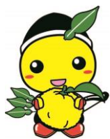
毛呂山町マスコット キャラクターもろ丸くん