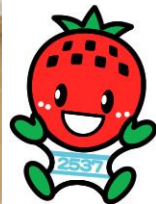
吉見町マスコット キャラクターよしみん