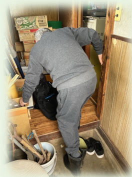
リハ職同行訪問：CMアセスメント支援

自治会の皆様、グループを運営している皆様、一緒にやってみませんか？ ぜひ市担当窓口またお近くの地域包括支援センターまでお問い合わせください。