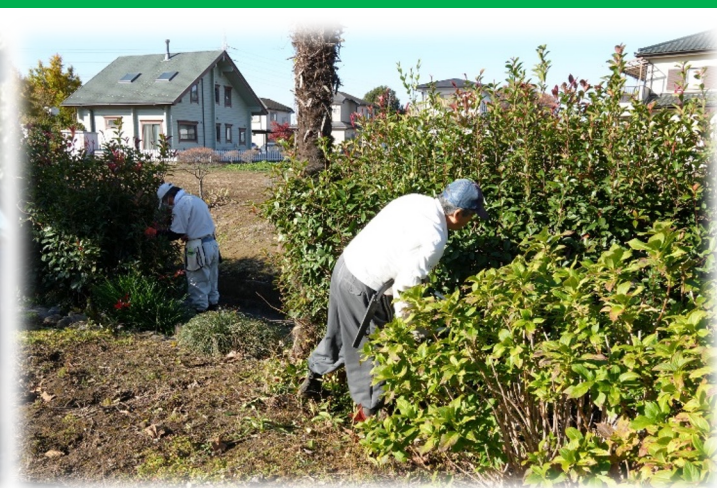
川越市 地域住民によるたすけあい活動（送迎支援・庭木の剪定 清掃支援）