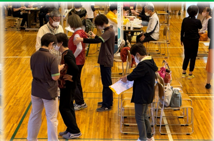
川越市 高齢者の保険事業と介護予防の一体的実施（個別相談・体力測定）