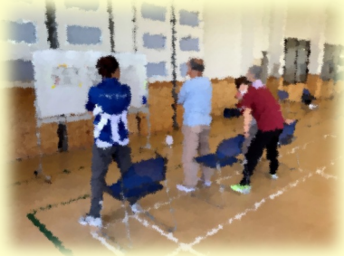
通所型サービスC事業