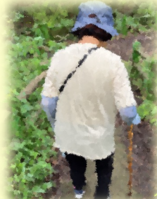
訪問型サービスC事業