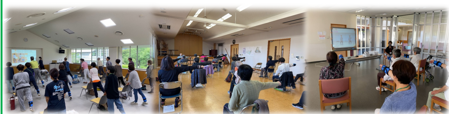
小川町 介護予防センター養成講座