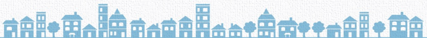
鳩山町 新規自主グループ 立上げ