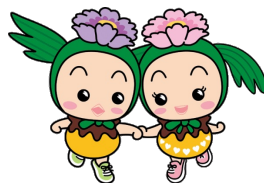
東松山市マスコットキャラクター まっくん・あゆみん

口腔機能低下・低栄養などのハイリスク者に対する支援体制の構築に向けて、専門職や関係者と意見交換を重ねました。市内だけでなく、近隣の市町村の保健師さん等担当者とも共有し連携しています。