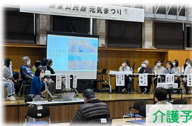
介護予防普及啓発