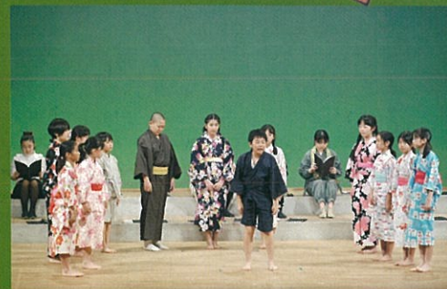
子ども劇団記念公演 群読劇「世のため後のため 塙保己一物語」