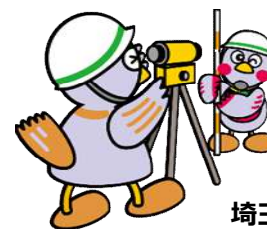
埼玉県マスコット 「コバトン&さいたまっち」