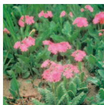
県の花「サクラソウ」