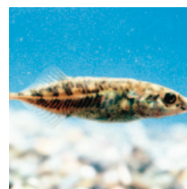
県の魚「ムサシトミヨ」