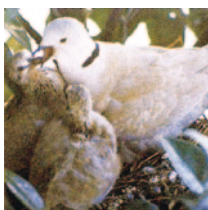
県民の鳥「シラコバト」