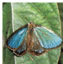
県の蝶「ミドリシジミ」