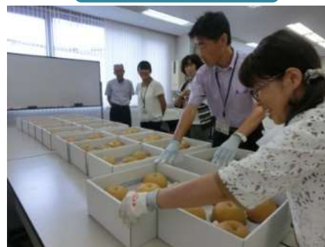
生産者が品質を競う