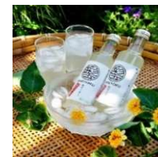
彩玉梨サイダー (彩玉梨加工研究会)