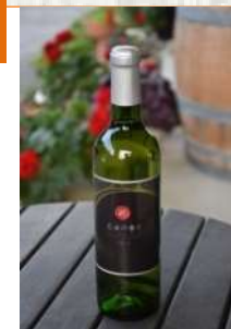
梨ワイン「乙女の香り」 (伊奈町観光協会)