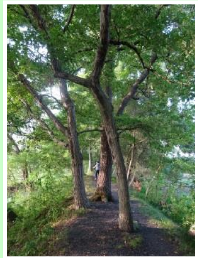
木々がくつろぐ道 市川 淑子 10号地