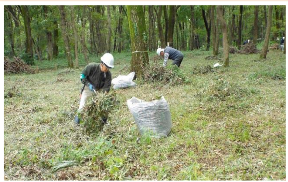
雑木林は私が守る 小森 和雄 14号地