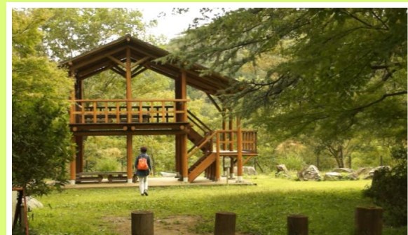
嵐の前の散歩道 鈴木 相二 3号地