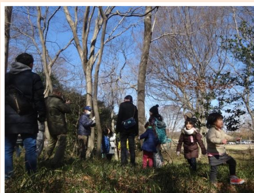
真冬の雑木林で自然観察会 塘 久夫 5号地