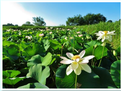
朝の蓮田 土屋 明 11号地