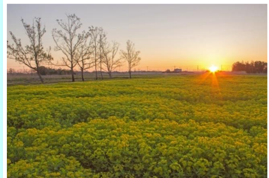
ノウルシ咲く 山中 敏郎 10号地