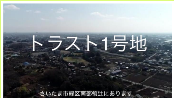
トラスト1号地は見沼の財産 加倉井 憲一 1号地