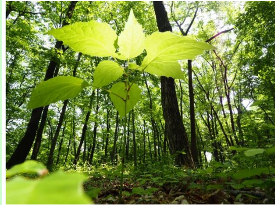
木漏れ日のスポットライト 木崎 信尚 4号地