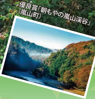
優良賞「朝もやの嵐山溪谷」 (嵐山町)

過去の動画作品も YouTubeチャンネル 「さいたま緑のトラスト運動」 で見られるよ