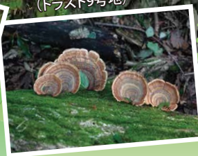
佳作「精霊たちのささやき」 (トラスト9号地)