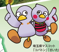
埼玉緑マスコット 「コバン」 「さいたまっち」