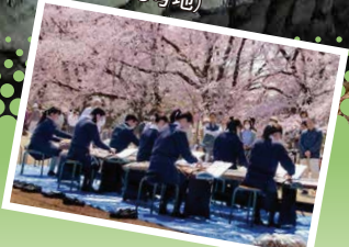
優良賞「桜の下で」 (トラスト13号地)