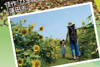
佳作「ひまわりきれいだね」 (蓮田市)