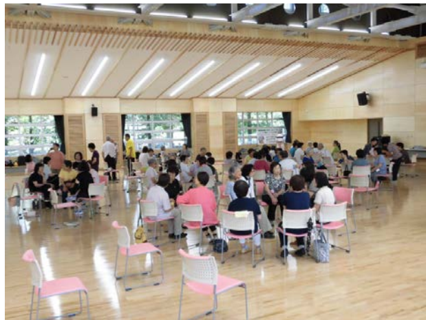
休憩時間の交流&おしゃべりの輪