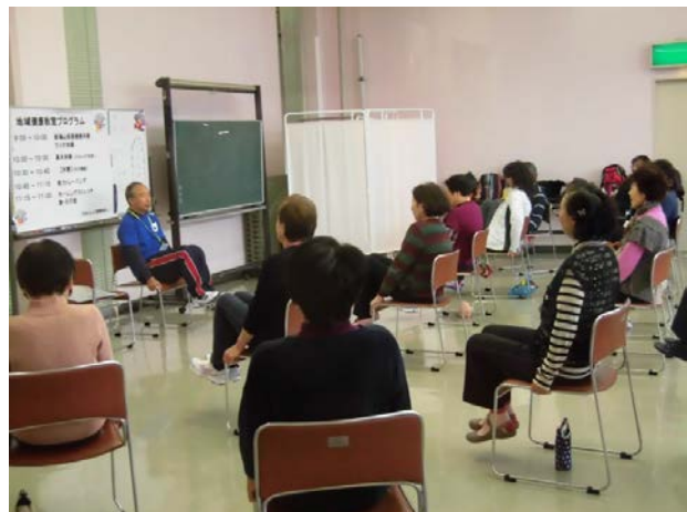
はあとらんど地域健康教室