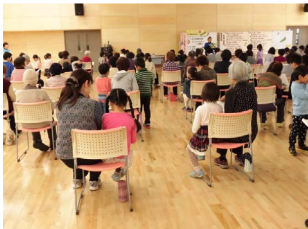
保育園児との交流会