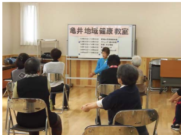
亀井地域健康教室