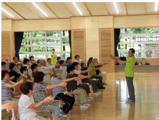
ニュータウン地域健康教室