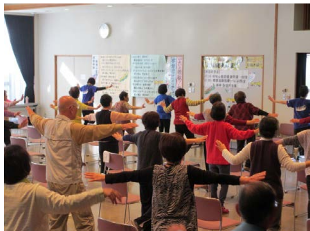
おしゃもじ山地域健康教室