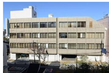
本社・東日本支社