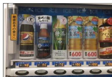
健康に留意した 自販機製品ラインナップ