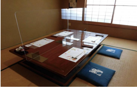
【③アクリル板の設置】