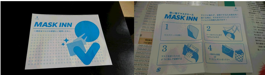
【①使い捨てマスクケースの配布・使用】