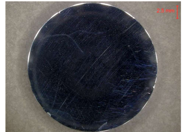
図：アルミのマイクロ스코ープ画像

※『X線マイクロアナライザによる分析（試料分析）』の成績書にマイクロ스코ープ画像は付属しません。